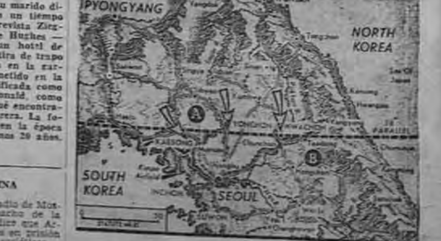
Las flechas abiertas indican los sectores del frente cerca del 28 paralelo en Corea en donde los chinos rojos están concentrados, para los Estados Unidos. Al Norte de Seoul, la, una fuerte cortina de fuego de la artillería roja y catradores exploraciones de grandes patrullas comunistas indiana la región por donde el avance principal de los chinos se preparó a cabo. En el extremo oriental del sector (B), en las altas montañas, se encuentran un gran movimiento constante de telefoto de la (AP).