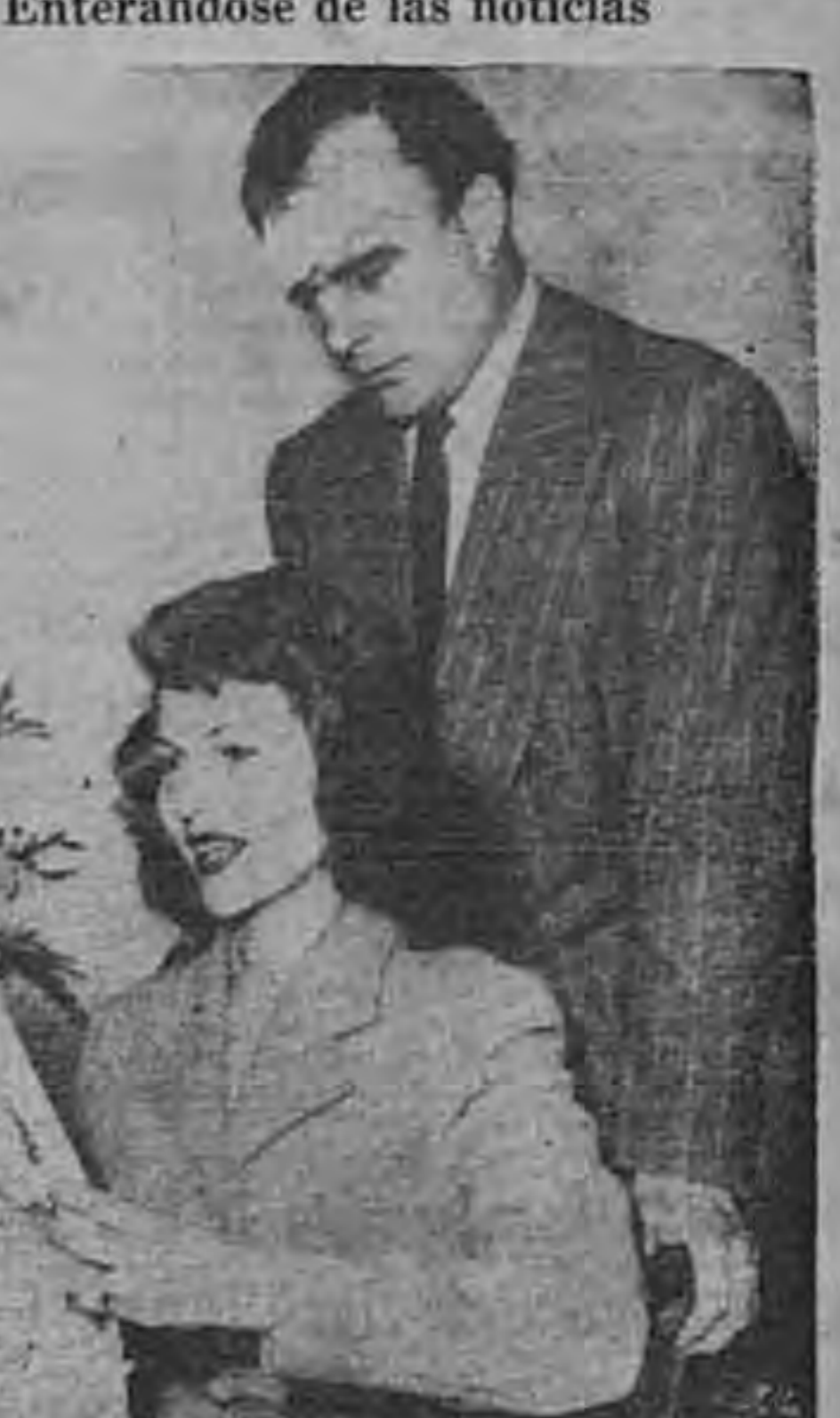
Ali Khan y su señora, la que fué Rita Hayworth, leen el periódico en su habitación del Hotel en Cairo, Egipto. Ali tiene la cabeza y nariz vendados por las heridas y contusiones que sufrió en un accidente de automóvil en Marruecos.