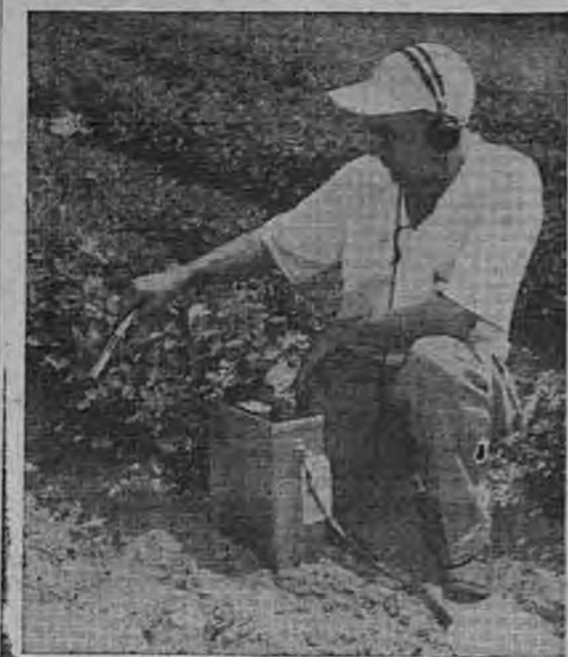
Los radioisotopos, producto de la explosión de los átomos, están siendo usados en los trabajos de investigación de la agricultura, la medicina y la industria. Su uso se considera de tanta importancia para la ciencia como el invento del microscopio. Un botánico en un Centro de Investigación del Departamento de Agricultura de los Estados Unidos prueba la efectividad de ciertas plantas de maní para absorber los abonos. Cantidades diminutas de la materia radioactiva mezclada con el abono pueden ser observadas en su trayecto por la raíz y las hojas de la planta a medida que la sustancia fertilizadora se expande por ella. El científico usa un contador Geiger para determinar la radiación. (FOTO USIS).

MANIFESTACIONES COMUNISTAS EN PARIS CONTRA EISENHOWER DISUELTAS POR LA POLICIA PARIS, Francia, 9. (AP)— Unos 4,000 comunistas hicieron una bulliciosa manifestación contra el General Eisen hower en el corazón de París hoy, pero fracasaron en su empeño de provocar la huelga. Se calcula que 3,000 policías parisien ses, una de las mayores concentraciones que se ha visto en ésta en los últimos meses, detuvieron a cerca de 200 manifestantes y o rdenaron a los demás a continuar circulando. No se produjeron des órdenes de consideración. La ma yoría de los observadores dicen que la huelga y la manifestación fueron un verdadero fracaso. Los líderes laboristas comunistas ha bían llamado a una "huelga patrió tica" que debía empezar a las 11:00 a. m. Las líneas de ómnibus y el subterráneo continuaron funcionando normalmente. Las fá bricas en los suburbios de la capi tal informaron que solamente se pararon de 30 minutos y har tá de una hora.